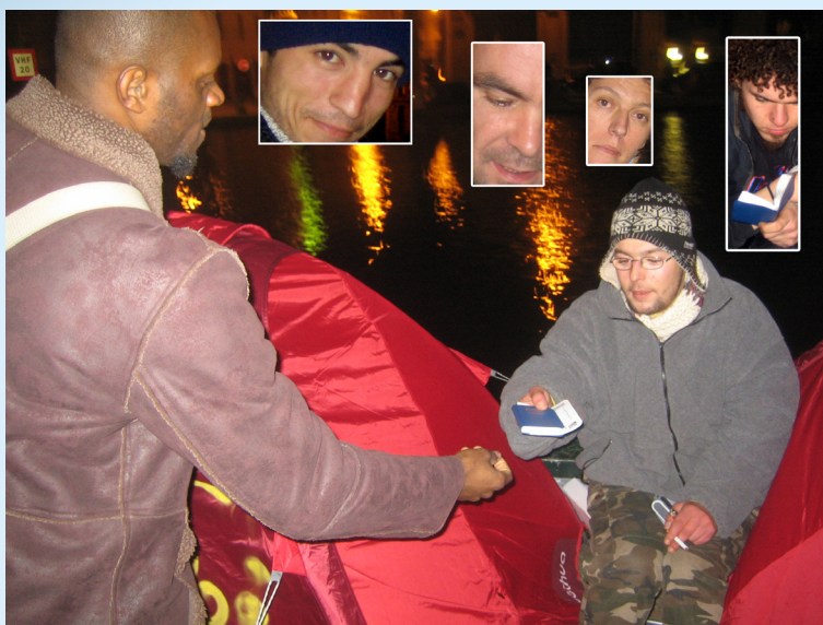
LES BIBLES SONT BIEN ACCUEILLIES