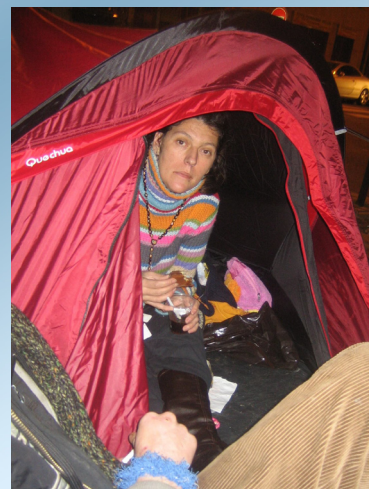
LA PAROLE EST DONNÉE AUX SANS-ABRIS

«Si ton frère devient pauvre, et que sa main fléchisse près de toi, tu le soutiendras; tu feras de même pour celui qui est étranger et qui demeure dans le pays, afin qu'il vive avec toi.» Lévitique 21 : 35